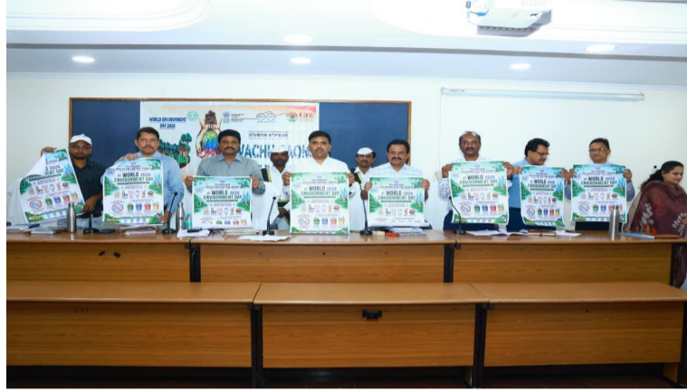
నల్గొండ జిల్లా జూన్ 01 నేటి వెలుగు ప్రతినిధి