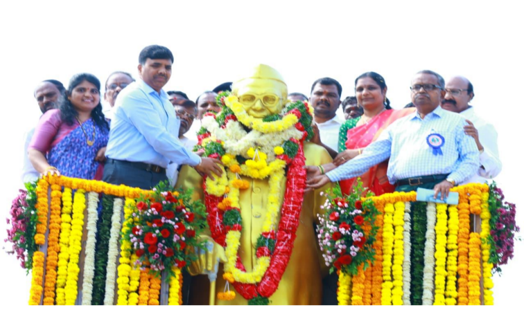
నల్గొండ ఏప్రిల్ 05 నేటి వెలుగు ప్రతినిధి